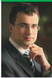
Przemysław Przybylski Rzecznik Prasowy ZUS