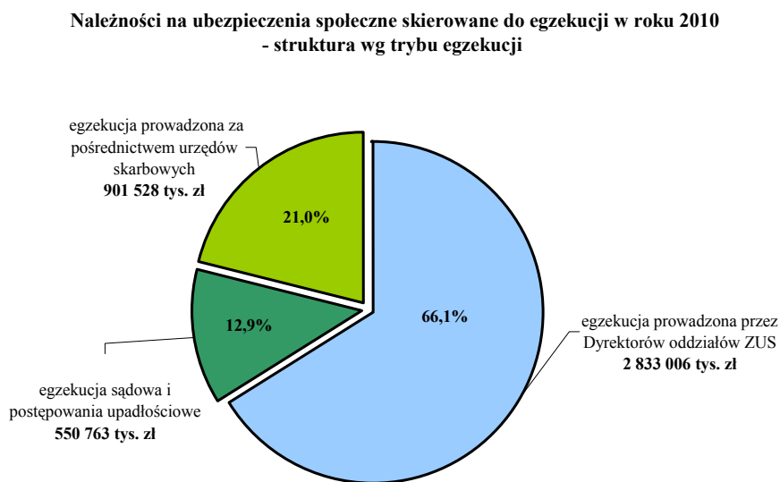
Wykres 1. Struktura należności z tytułu składek na ubezpieczenia społeczne skierowanych do egzekucji w 2010 r.

Poniższy wykres obrazuje strukturę przymusowo dochodzonych należności z tytułu składek na ubezpieczenia społeczne skierowanych do egzekucji w 2010 r.